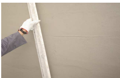
Processo de corte da superfície