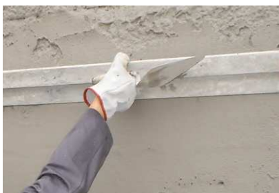
Aperto da argamassa