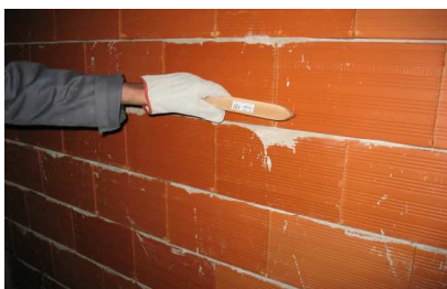
Preparação do suporte