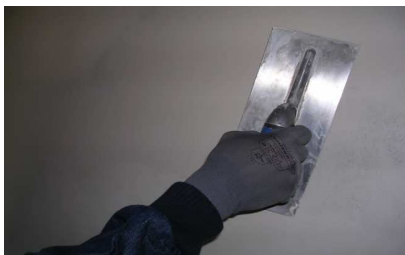
Aplicação do acabamento após cura

Nota: O H-DUR deve ser aplicado com o mínimo de água que permita uma boa trabalhabilidade e com espessuras superiores a 1 cm e inferiores a 2 cm para evitar fissuração.