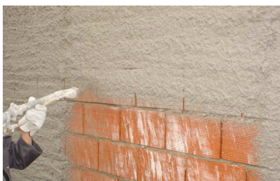
Projecção do H-DUR