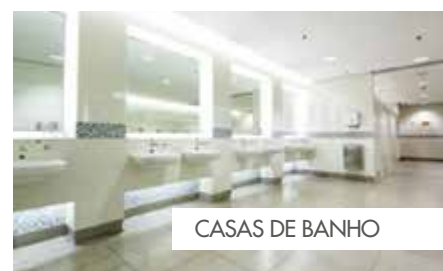
CASAS DE BANHO

A Knauf Drystar é uma solução segura para os ambientes húmidos em praticamente todas as áreas de aplicação. A placa Drystar está comprovada e demonstrada. A sua inovadora combinação de um véu de alta tecnologia com um núcleo de gesso especial reforçado com fibra de vidro permite que esta placa seja capaz de repelir a água e resistir ao bolor.