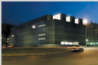
Casa del Deporte y Frontón, Bilbao