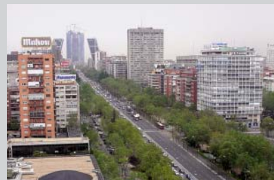
Viviendas de Lujo, Paseo Castellana, Madrid