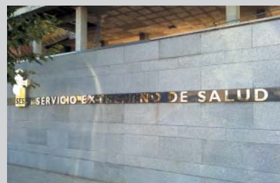
Servicio Extremeño de Salud, Mérida