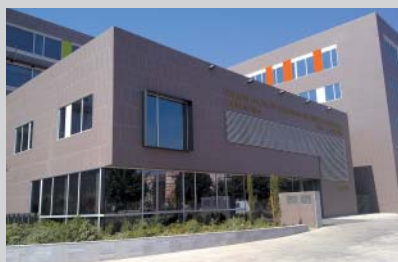
Colegio de Ingenieros Industriales, Castellón

Algunos ejemplos de edificios en España donde se han utilizado conductos Climacoustic: