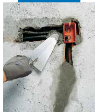
Fixação de caixas e calhas eléctricas com Lampocem