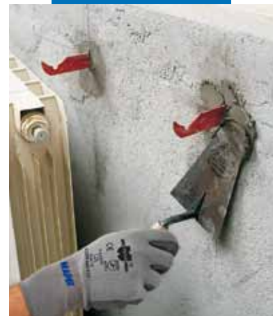
Assentamento de grampos para radiadores com Lampocem