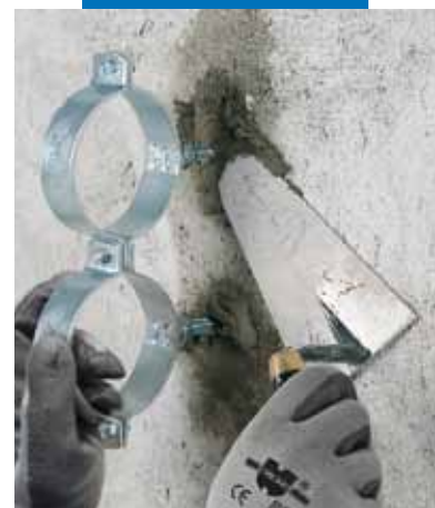
Fixação de braçadeiras para tubagens com Lampocem