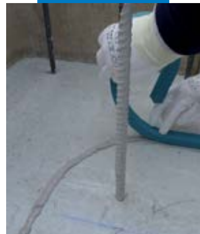
Aplicação de Idrostop Soft sobre superfícies horizontais

As referências relativas a este produto estão disponíveis a pedido e no site da Mapei www.mapei.pt e www.mapei.com