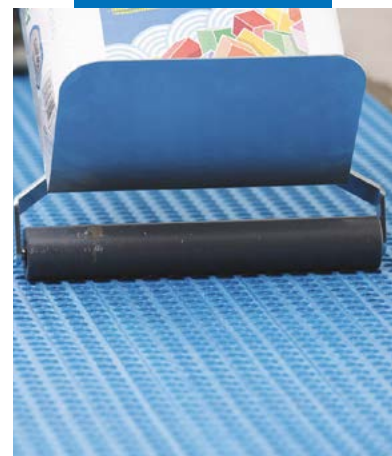
Pressionamento de Mapeguard UM 35