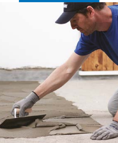
Aplicação do adesivo com espátula dentada n. 5