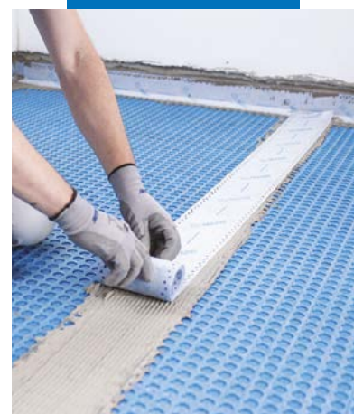
Impermeabilização das junções entre as telas adjacentes com Mapeband Easy colado com Mapeguard WP Adhesive