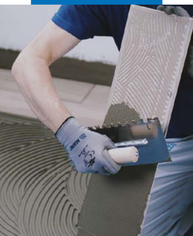
Assentamento do pavimento em cerâmica ou material pétreo com adequado adesivo Mapei de classe não inferior a C2