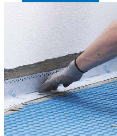
Impermeabilização perimetral com Mapeband Easy colado com Mapeguard WP Adhesive