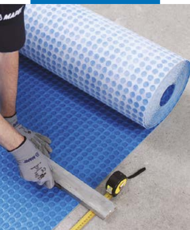
Cortar Mapeguard UM 35 à medida