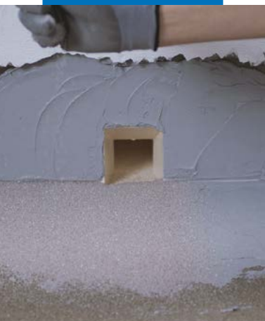
Impermeabilização da descarga com Drain Front