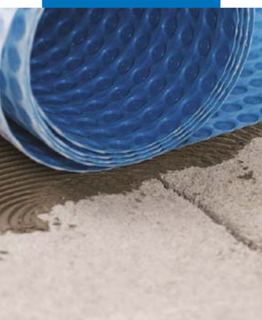
Aplicação de Mapeguard UM 35