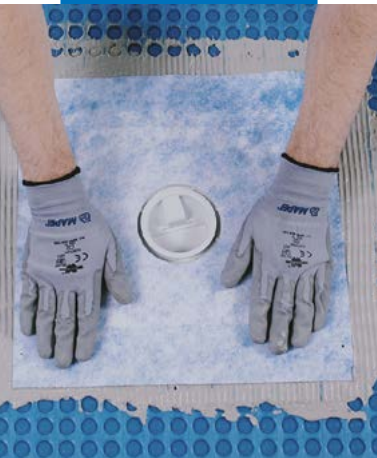
Impermeabilização da descarga com Drain Vertical/ Drain Lateral