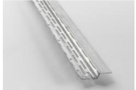
PERFIL ALETA GALVANIZADA